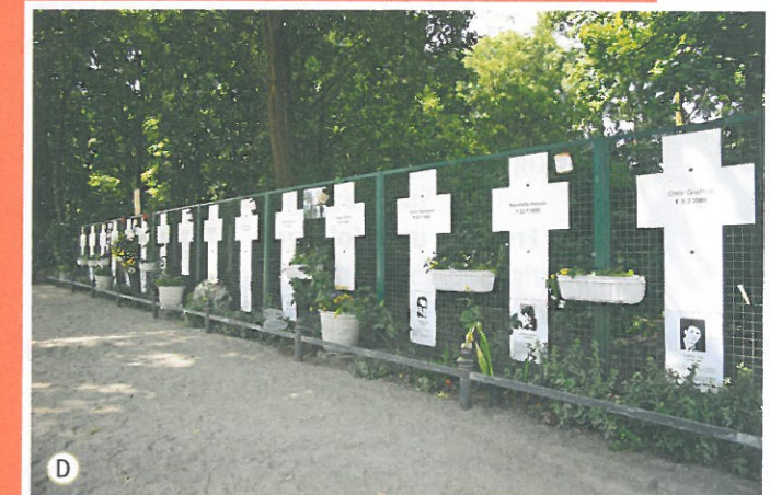
Die Kreuze erinnern an die Mauertoten.

spät. Am 6. Februar 1989 wollte der 20-jährige Ostberliner über die Mauer in den Westen. DDR-Grenzsoldaten sahen das und schossen auf den jungen Mann. Er starb, verblutete neun Monate vor dem Fall der Mauer. Chris Gueffroy war der letzte Mauertote.