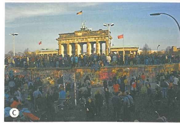
Nach dem Mauerfall tanzen die Menschen auf der Mauer.

meisten Ostdeutschen wollten mehr Freiheit. Sie wollten überallhin reisen können.