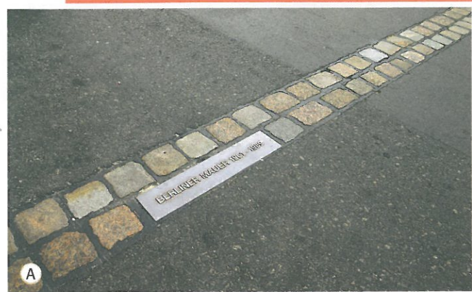
Erinnerung an die Berliner Mauer

10 »Die Zeit heilt 2 alle Wunden 3 «, sagt ein deutsches Sprichwort.